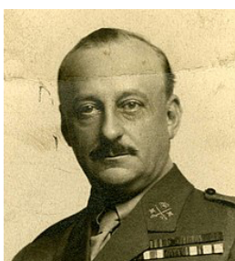
Primo de Rivera.

Mientras tanto, los Gobiernos de Berenguer y luego de Aznar , se propusieron organizar un escalonado proceso electoral que otorgara el consenso al régimen monárquico. Pero las elecciones municipales del 12 de abril de 1931 terminaron convirtiéndose en un plebiscito sobre la monarquía. Aunque salieron elegidos más concejales monárquicos que republicanos , estos últimos triunfaron en la España urbana . El día 13, tras conocerse los resultados electorales, miles de personas salieron a la calle para manifestarse a favor de la república. El 14 de abril de 1931 se proclamó la segunda república y Alfonso XIII tomó el camino del exilio.