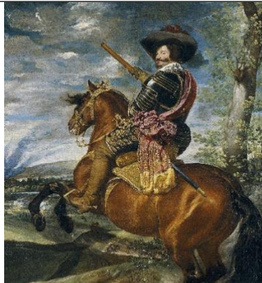
Conde-duque de Olivares