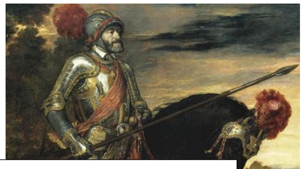
Carlos I de España y V de Alemania