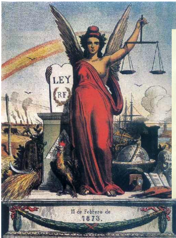
Alegoría de la Primera República