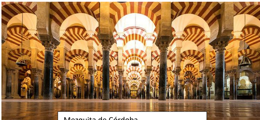
Mezquita de Córdoba

Artísticamente podemos destacar la Mezquita de Córdoba, Medina Azahara, la Giralda de Sevilla y la Alhambra de Granada.