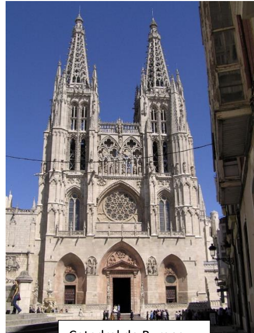
Catedral de Burgos